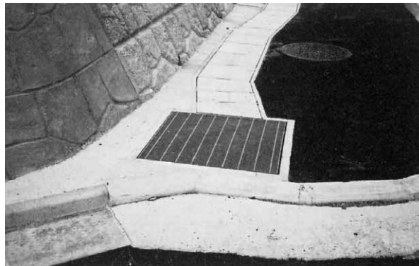
山田岡地区歩道工事